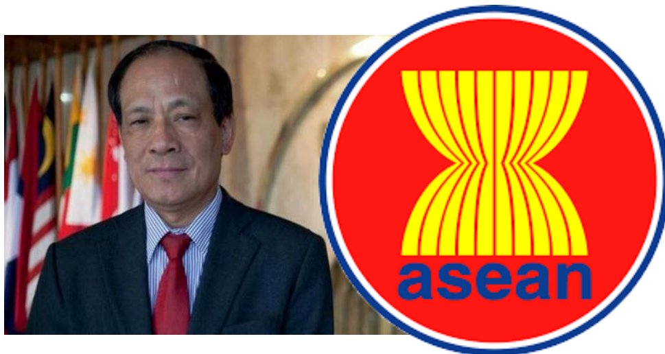
นายเล เลื่อง มินห์ ชาวเวียดนาม

4.1 สำนักเลขาธิการอาเซียน หรือ ASEAN Secretariat ที่กรุงจาการ์ตา ประเทศอินโดนีเซีย เป็นศูนย์กลางในการติดต่อระหว่างประเทศสมาชิก โดยมีเลขาธิการอาเซียน (ASEAN Secretary-General) เป็นหัวหน้าสำนักงาน ผู้ดำรงตำแหน่งคนปัจจุบัน คือ นายเล เลื่อง มินห์ ชาวเวียดนาม ซึ่งมีวาระในการดำรงตำแหน่ง 5 ปี (ตั้งแต่วันที่ 1 มกราคม 2556 - 31 ธันวาคม 2560 )