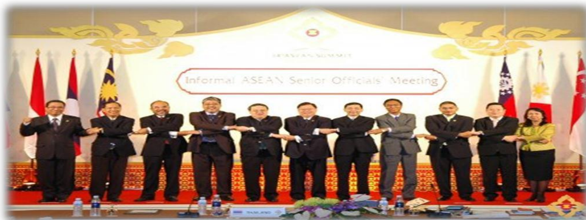
การประชุมกฎบัตรอาเซียน

วัตถุประสงค์ของกฎบัตรอาเซียน คือ ทำให้อาเซียนเป็นองค์กรที่มีประสิทธิภาพ มีประชาชนเป็นศูนย์กลางและเคารพ กฎ กติกา ในการทำงานมากขึ้น นอกจากนี้กฎบัตรอาเซียนจะให้สถานะนิติบุคคลแก่อาเซียนเป็นองค์กรระหว่างรัฐบาล (Intergovernmental organization)